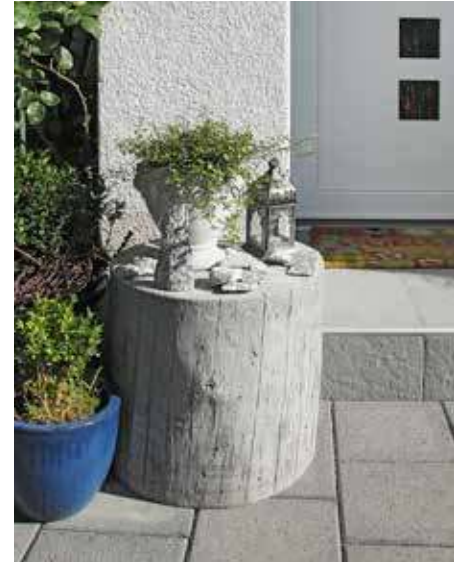
Verblüffend echte Holzoptik.