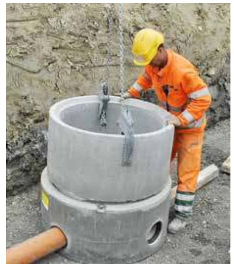
Der Schachtaufbau besteht in der Regel aus Betonrohren und -konen. Bei niedrigen Überdeckungshöhen werden anstelle von Konen Abdeckplatten eingebaut. Entsprechende Belastungsklassen müssen berücksichtigt werden. Für die Ausführung von wasserdichten Verbindungen richtiges Dichtungsmaterial verwenden.