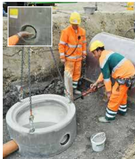
Dichtringe mit Gleitmittel in genügender Menge einschmieren. Den Schachtboden während der Versetzung nicht vollständig vom Hebegerät lösen. Den Zusammenzug mit dem Zugerät oder einer Stockwinde ausführen. Die Baggerschaufel ist dafür ungeeignet.