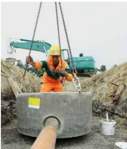
Vor dem Versetzen des CRENO Normschachtbodens muss eine höhengerechte und horizontale Sohle hergestellt werden. Geeignet sind Magerbeton, Sand, Kies oder Splitt. Im besten Fall kann der Schachtboden direkt auf das gewachsene Terrain gestellt werden.