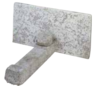
Frontplatte mit Normalanker