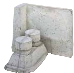
Eckstein mit Eckanker