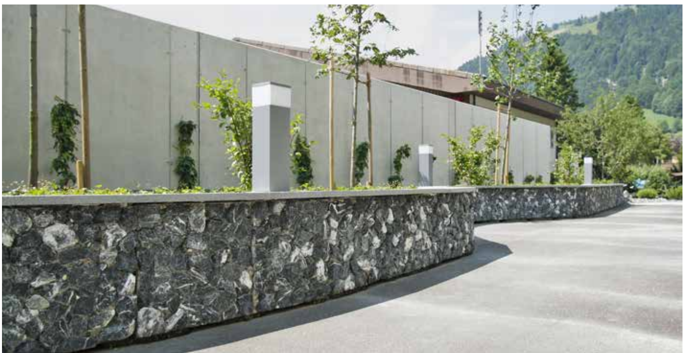
HARODABLOCK Mauer mit Alpenkalk schwarz.