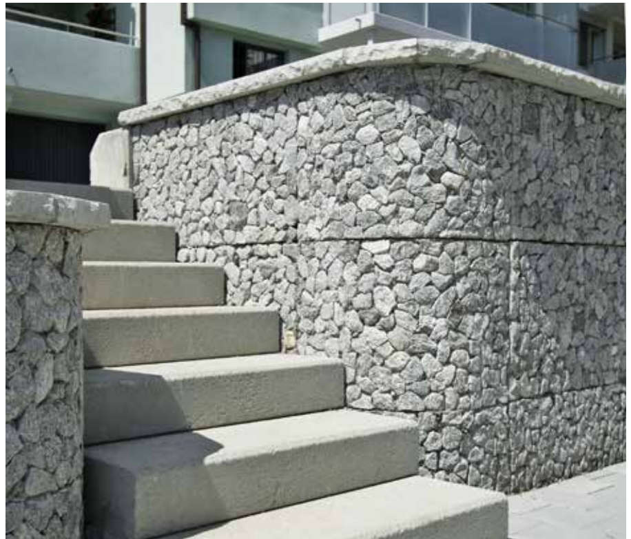
HARODABLOCK Mauer mit Tessinergranit.